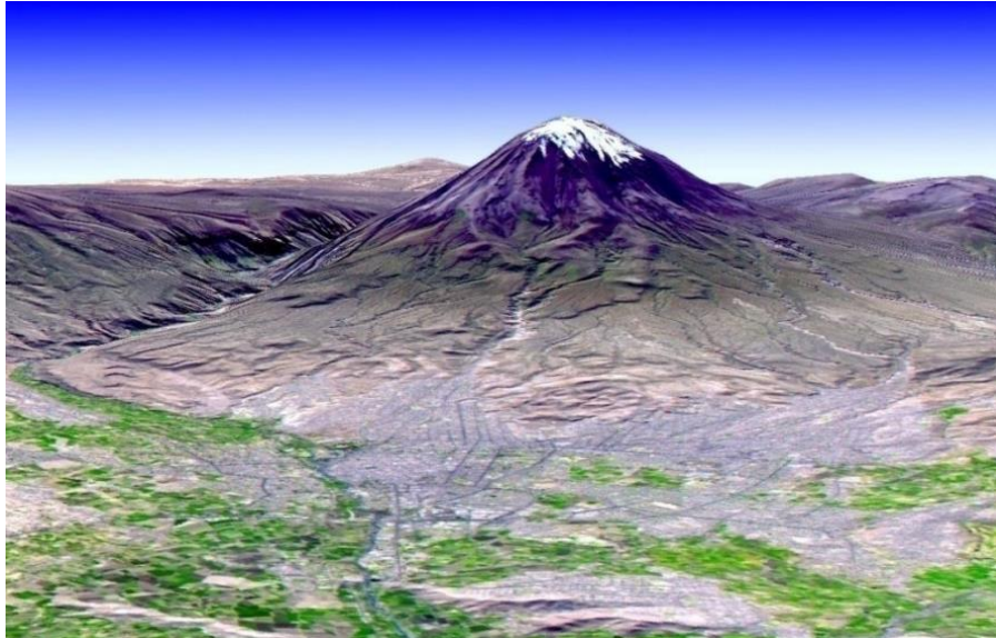
Vista panorámica de la ciudad de Arequipa.